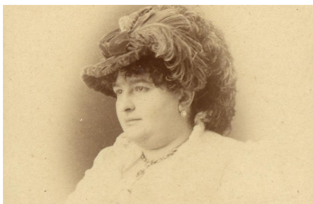
Retrato de Emilia Pardo Bazán con chapeau , c. 1880-1890.