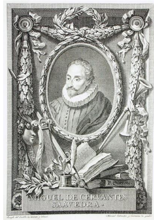
Retrato de Miguel de Cervantes por José del Castillo para la edición de la RAE del Quijote en 1780